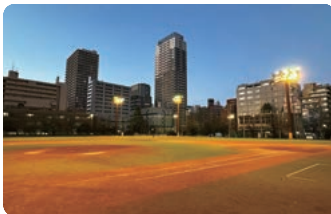
▲現在の豊島区立総合体育場

また、西巣鴨中・朋有小の小中連携校においても、それぞれの校庭面積の確保など、懸念点が払拭できるよう教育環境の整備に向け注視します。